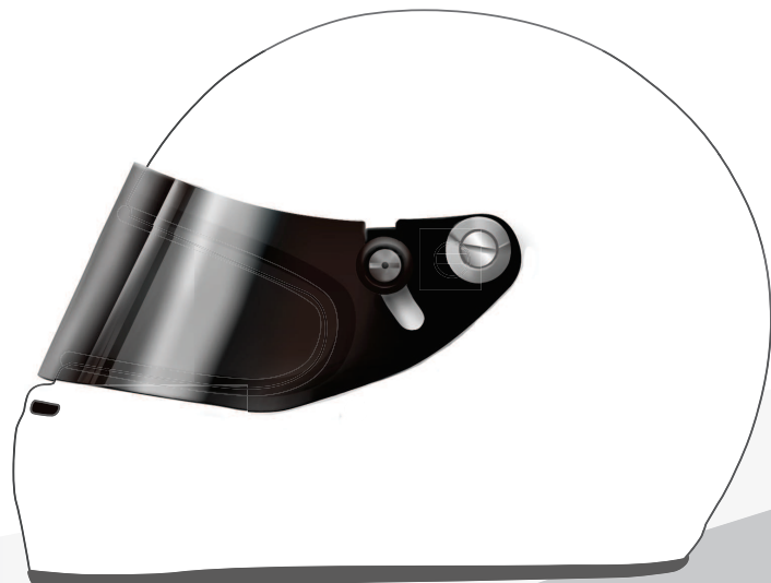
横から見た図を基本に製作致します。