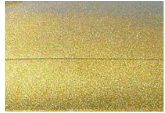
ペイント施行例 ゴールドラメ

いわゆるラメです。いろいろな色の粒子が混ぜ合わされた粒子の大きなメタリック塗料とお考えください。キラキラした発色をします。光のあたり具合によって色が変わります。近年ナイトレースでよく使われます。