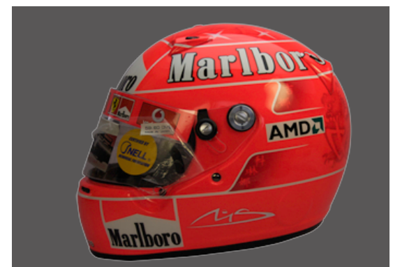
ペイント施行例 シューマツハ蛍光レッド

カスタムペイントに使われる蛍光塗料は、夜間に発色をするものではありません。鮮やかな発色をして、光量の少ない時でも遠くからでも目立つ発色をします。基本的に多くの色はありませんが、混色は可能です。