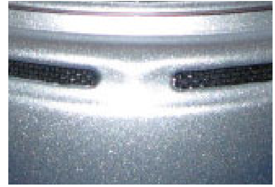
ペイント施行例 メタリックシルバー

メタリック塗料は細かなアルミの粒子をクリアーに混合したものです。ペイントの方法によりメタリック粒子の並び方が変わり、反射光の見え方が変化します。彩度を押さえた落ち着いた色合いになります。