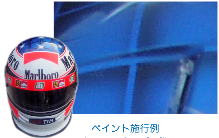
ペイント施行例 シューマツハキャンディブルー

半透明の色です。最近はシルバーメタリックの上にパターンを濃い色でグラデーションペイントをし、その上にキャンディカラーをペイントをします。メタリックカラーより深みのある色が表現できます。